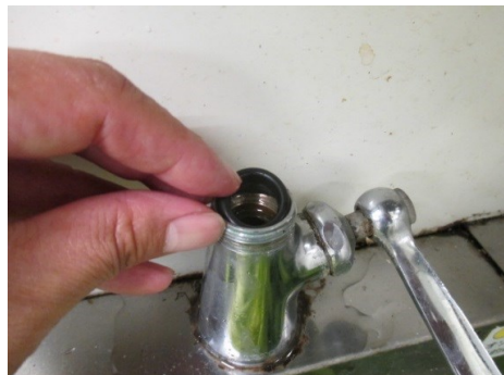
パイプを外して設置します