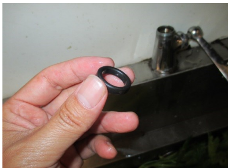
これがパイプパッキンです

これは、実はよく発生する事例ですが、水を出すと、パイプの根元から水漏れがします。原因はパイプパッキンの劣化によるもので、交換をすれば良いのですが、大体の施設では、放ったらかし状態です。衛生面からも、よくありませんので、このような状況を確認した場合は、無償にてパイプパッキンの交換を行っております。