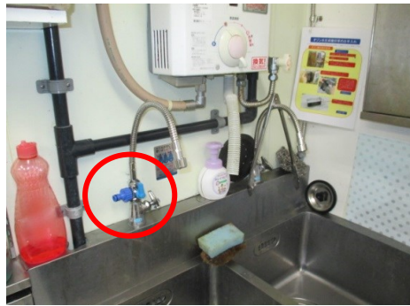
根元に分岐金具を設置します